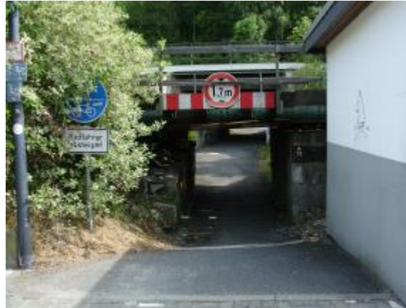
Die Unterführung im Bereich der Tankstelle Friederichs, marode und mit geringer Kopfhöhe, kann künftig entfallen.