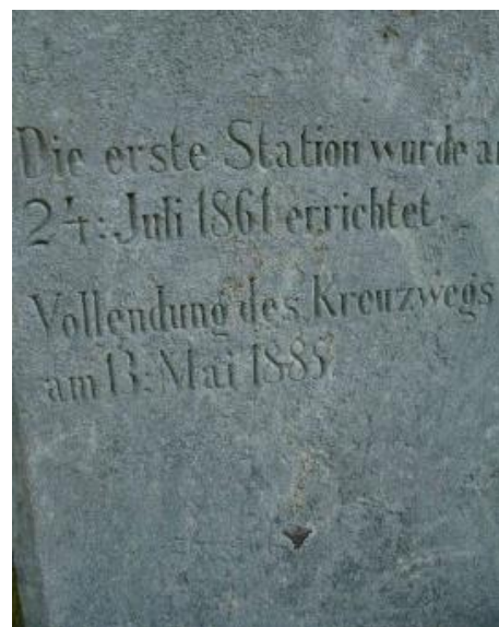
In Stein gemeißelt: Von 1861 bis 1885 hat es eine ganze Generation gedauert, bis die Nuttlarer ihren Kreuzweg vollenden konnten.