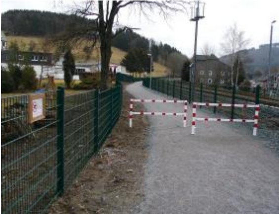
Unmittelbar an der Bahnstrecke entlang führt der neue Verbindungsweg vom Ortskern Richtung Dümel.